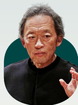
Myung-Whun Chung 鄭明勳

Recorded at Royal Albert Hall, London on 21/7/2008