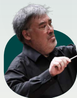
Alan Gilbert 基爾拔

Recorded at Suntory Hall, Tokyo on 28/11/2023