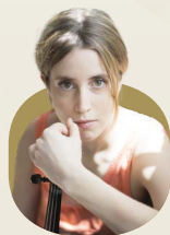
Vilde Frang 法蘭

Web archive is available for 30 days 本節目將提供三十日網上重溫