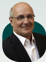
Michel Bouvard 保發特

Recorded at Palace Hall, Bucharest on 1/9/2023