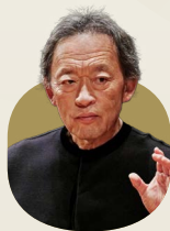
Myung-Whun Chung 鄭明勳

Web archive is available for 30 days 本節目將提供三十日網上重溫