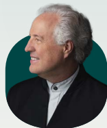
Manfred Honeck 漢力克

Recorded at Romanian Athenaeum, Bucharest on 30/8/2023