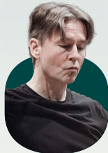
Esa-Pekka Salonen 沙朗倫

Recorded at Louise M. Davies Symphony Hall, San Francisco on 23/6/2022