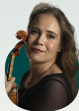
Leila Josefowicz 約絲科域芝

Recorded at Louise M. Davies Symphony Hall, San Francisco on 10/3/2022 2022年3月10日 三藩市路易斯戴維斯 交響音樂廳錄音