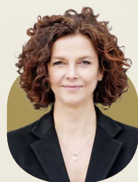
Angelika Kirchschrager 卻舒拉格

Recorded at the Royal Albert Hall, London on 6/8/2006