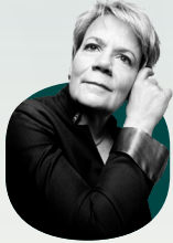
Marin Alsop 艾爾梭

Recorded at Philharmonie, Berlin on 1/10/2023