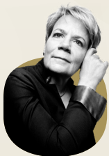
Marin Alsop 艾爾梭

Recorded at Philharmonie, Berlin on 1/10/2023