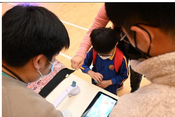
《社區公眾教育服務》 ▲學生為公眾人士介紹樂齡科技工具