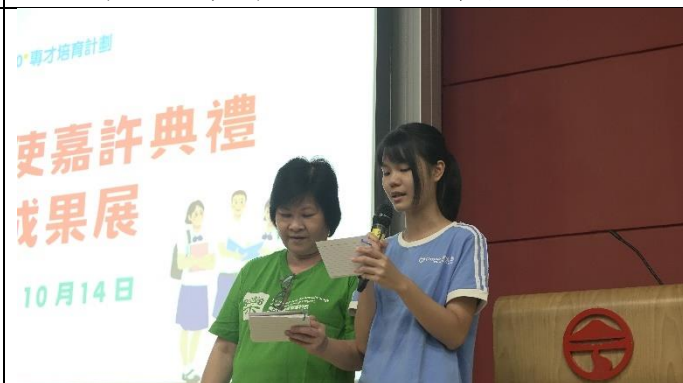
《樂齡科技大使嘉許典禮及巡迴成果展》 學生與長者一同擔任典禮主持， 體現長青共融