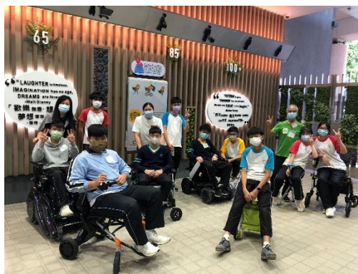
《樂齡科技導賞團》 ▲長者向學生介紹樂齡科技工具，促進交流