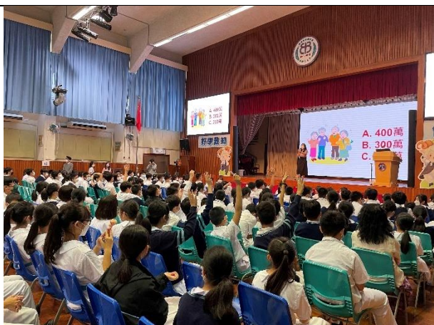
《樂齡科技講座》 ▲學生積極回應情景題問答