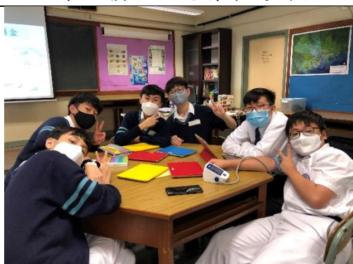
《樂齡科技大使培訓》 ▲學生樂於試用樂齡科技工具